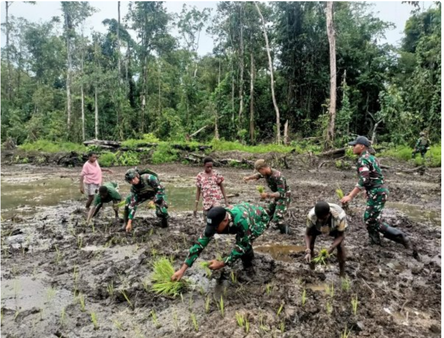
Foto: Satgas Pamtas Mobile RI-PNG Yonif 503/Mayangkara menggagas program ketahanan pangan yang melibatkan langsung warga Kampung Mumugu, Distrik Krepkuri, Kabupaten Nduga, Selasa (07/01/2025).

NDUGA- Dalam upaya membangun kesejahteraan masyarakat di wilayah penugasan Papua Pegunungan, Satgas Pamtas Mobile RI-PNG Yonif 503/Mayangkara