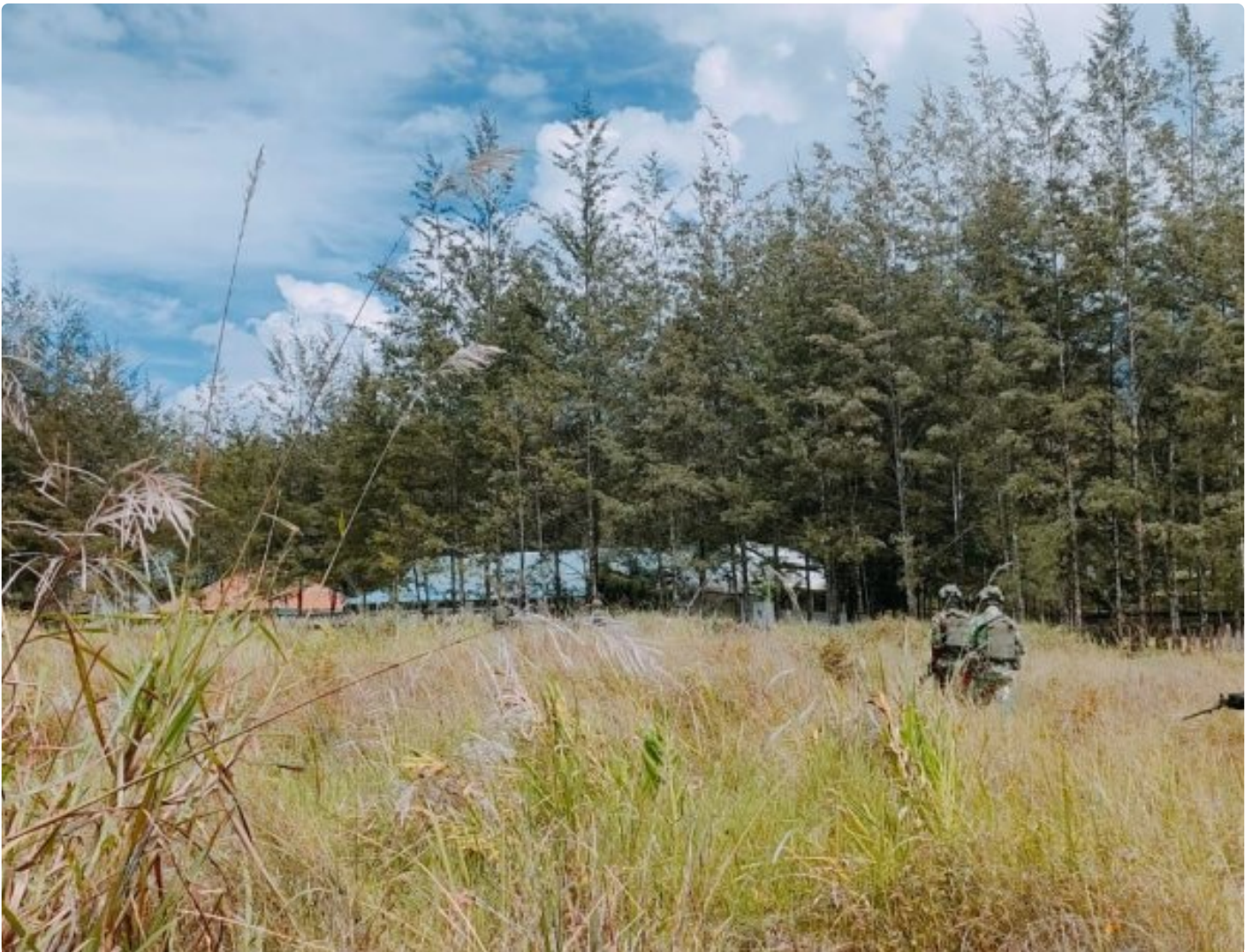
Satgas Yonif 323 Amankan Anggota OPM terduga pelaku tindak Kriminal

Satgas Mobile Yonif 323/Buaya Putih Kostrad berhasil menangkap salah satu anggota Organisasi Papua Merdeka (OPM) yang diduga terlibat dalam sejumlah